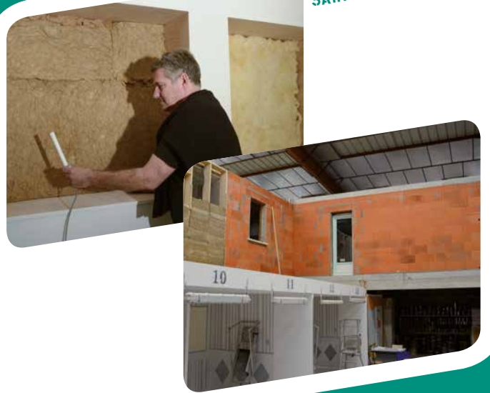
SAINT-JEAN DE VÉDAS